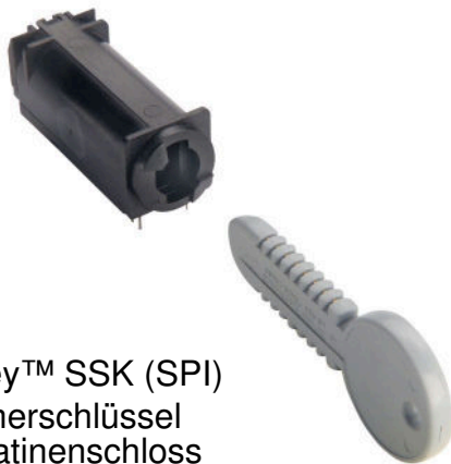
Datakey™ SSK (SPI) Speicherschlüssel und Platinenschloss

In dieser Zeit stieß ein Entwickler bei Bombardier in einer Elektronik-Fachzeitschrift auf einen Artikel über Klix-Kaffeeautomaten, in denen ein Memory-Key von Datakey zum Einsatz kommt, um individuelle Konten für jeden Benutzer zu erstellen und so eine bequeme bargeldlose Zahlung zu ermöglichen. Daraufhin kontaktierte Bombardier das Unternehmen Nexus, das schnell erfasste, welche Anforderungen gestellt wurden, und Bombardier mehrere Optionen präsentierte.